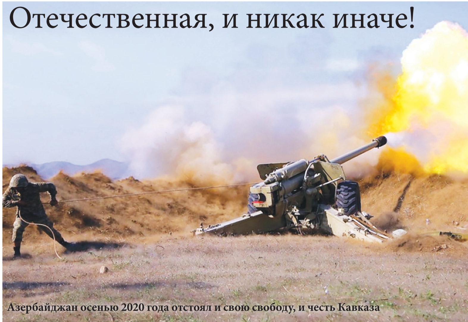
Азербайджан осенью 2020 года отстоял и свою свободу, и честь Кавказа

12 октября 2020 года Президент Ильхам Алиев дал интервью турецкому телеканалу Haber Global, корреспондент которого единственным из коллег относительно стремительного продвижения Национальной армии в Карабахе уже в преамбуле использовал фразу «братский Азербайджан ведет Отечественную войну».